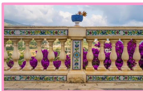
Santo Stefano di Camastra